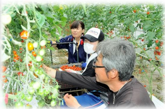
ミニトマトの収穫